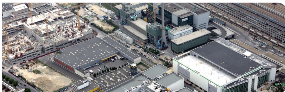
SYCTOM de l'agglomération parisienne